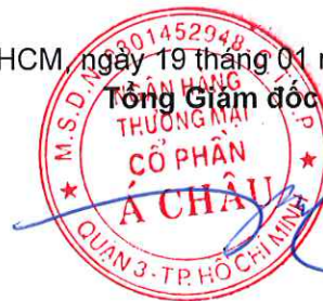
Từ Tiên Phát