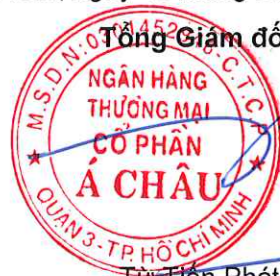
Từ Tiên Phát